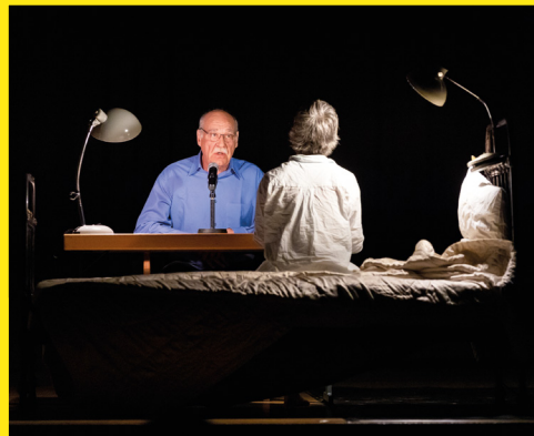
Choristes, cuisiniers, lycéens, commerçants, pas moins de 200 participants de Rumelange se sont associés au projet EKINOX et ont permis de rendre cette journée magique. Qu'ils en soient ici chaleureusement remerciés.