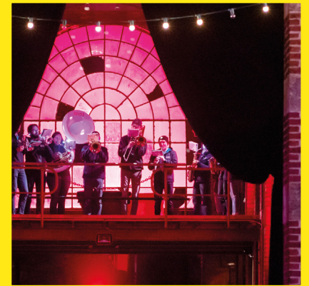
Ci-dessous, Déambulation dans les rues de Rumelange lors du spectacle Deblozay, de la cie Rara Woulib